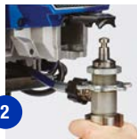
2 Avaa luukku ja irrota pumppu