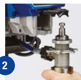
2 Ouvrir le clapet et retirer la pompe.