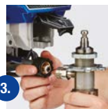
3. Avlägsna slangen och sugröret