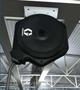
Tavana/Duvara Sabit Montaj (opsiyonel)