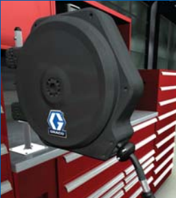
Tezgâha Montaj (opsiyonel)