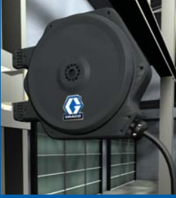
Tavana/Duvara Firdöndülü Montaj (standart)

Kaliteli hortum makaraları dakikalar içinde monte edilir - yıllarca sorunsuz performans sağlar!