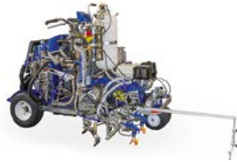
LineLazer V 250mma 98:2