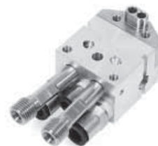
流体口在后部的歧管底座