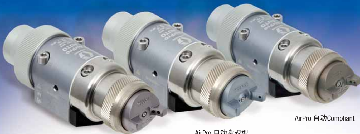
AirPro 自动 HVLP