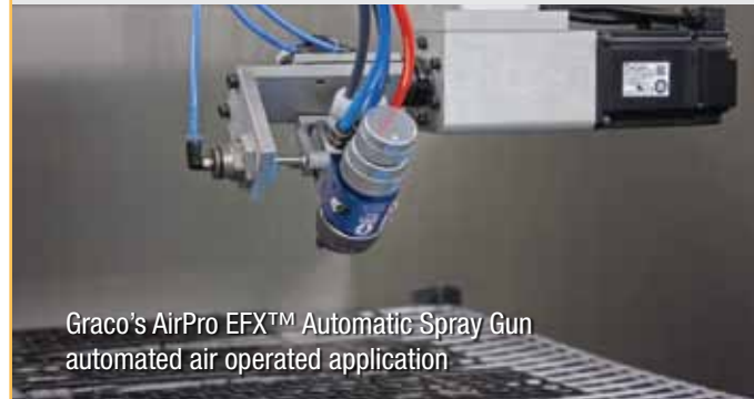
Graco's AirPro EFX™ Automatic Spray Gun automated air operated application