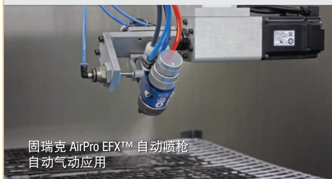
固瑞克 AirPro EFX™ 自动喷枪 自动气动应用