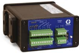
Módulo ACS de Graco