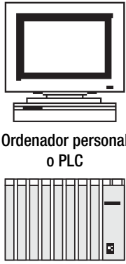
Ordenador personal o PLC