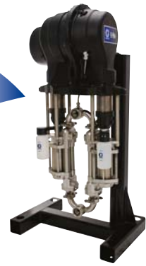
Bomba de pistón de 4 bolas E-Flo