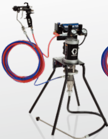
15:1エアアシスト スタンド型