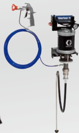
30:1 エアレス 壁取付型