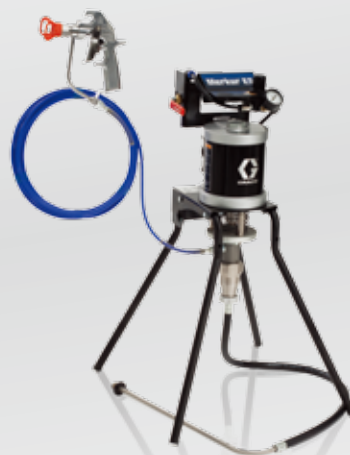
30:1 エアレス スタンド型