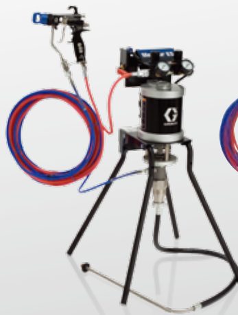
30:1エアアシスト スタンド型