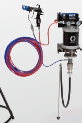
30:1エアアシスト 壁取付型