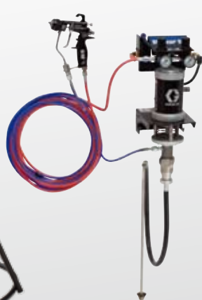
15:1エアアシスト 壁取付型