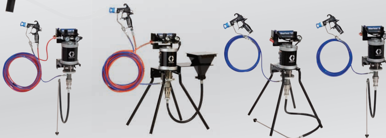
30:1エアアシスト 壁取付型