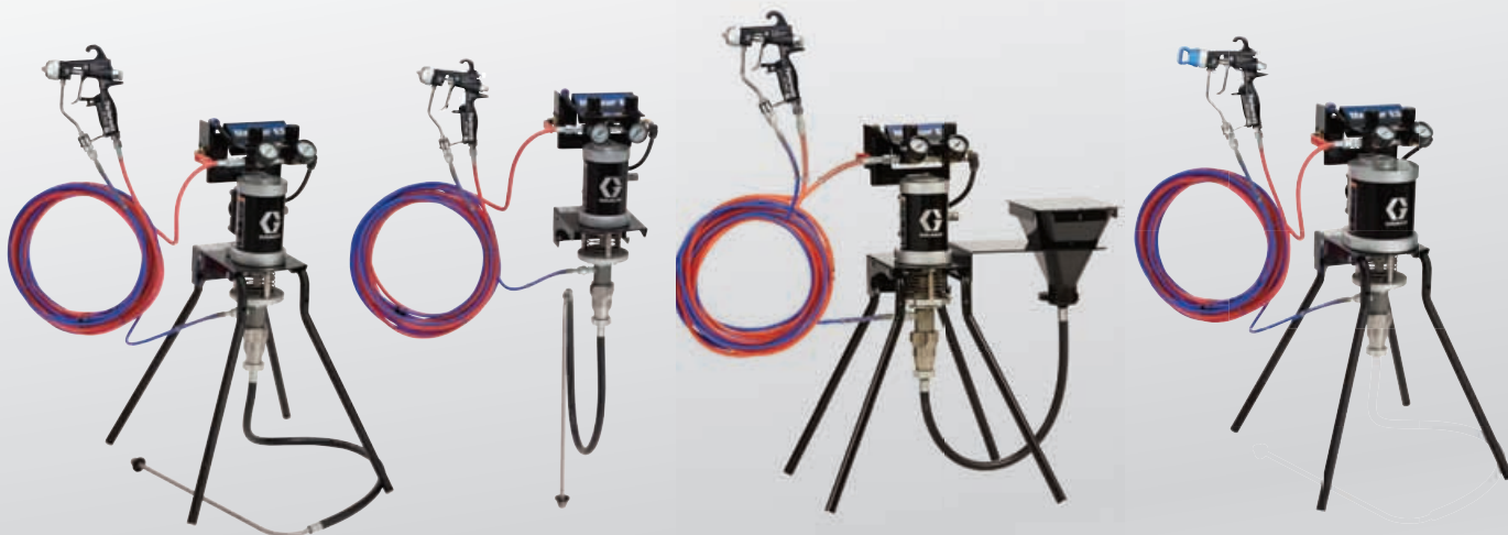
15:1エアアシスト スタンド型