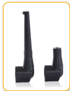
Sonda de carga externa

Diseñada para una desconexión rápida y una limpieza sencilla.