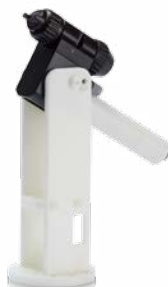
Solide pols Mengblok achteraan