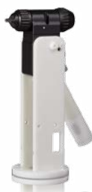
Solide pols Mengblok onderaan