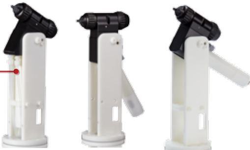
中空手腕 底部歧管