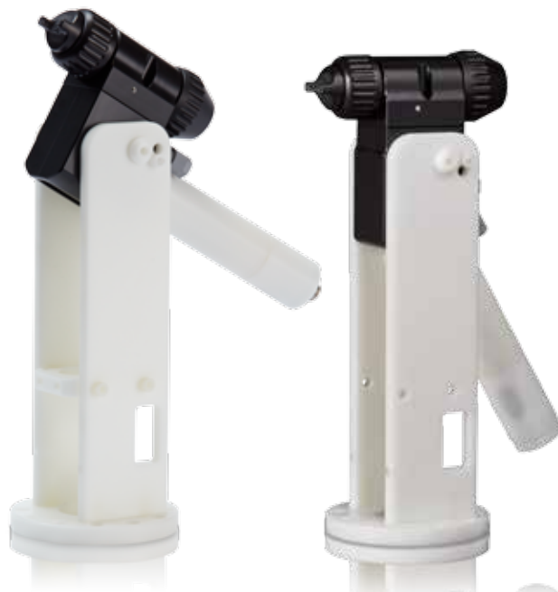
后部歧管喷枪 带机器人支架

喷枪型号包括产品编号为 24N477 的气帽和产品编号为 24N616 的 1.5 mm (0.055 in) 喷嘴