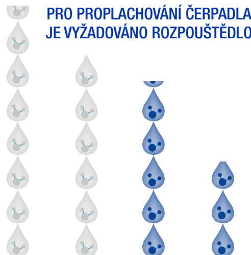
Konkurenceschopné pístové čerpadlo Konkurenceschopné membránové čerpadlo Endura-Flo 4D350 Endura-Flo 4D150