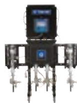
ProMix Auto 精密流量控制，可确保涂膜厚度均匀