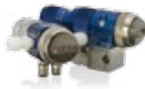
AirPro EFX 极佳的雾化和精密喷幅控制