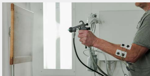
Les tests présentés ont consisté à pulvériser de l'eau pendant le contrôle de l'effort musculaire effectué par United States Ergonomics.

Suite à des recherches et des tests approfondis, le Stellair ACE et le Stellair sont devenus les seuls pulvérisateurs de peinture de l'industrie à obtenir la certification de performance ergonomique.