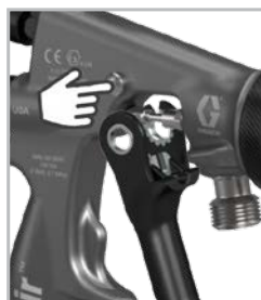
Retrait de la gâchette sans outil