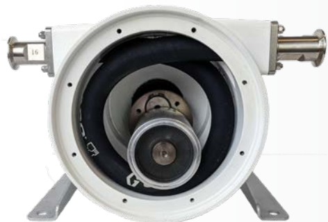
Design a rullo singolo.