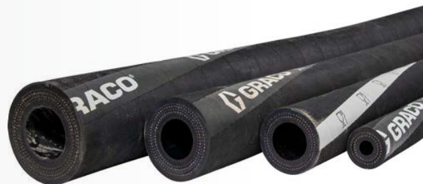
Tubi flessibili con approvazione FDA