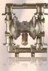
SaniForce 2150 63,5 mm (2,5 hüvelyk)