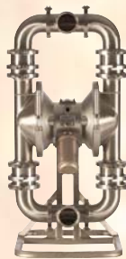
SaniForce 3150 HS 76 mm (3 hüvelyk)