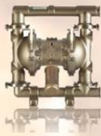
SaniForce 1590 50,8 mm (2 hüvelyk)