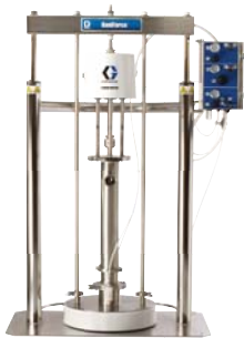
SaniForce 5:1 Hordóürítő