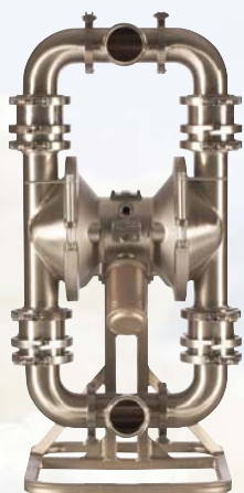
SaniForce 3150 HS