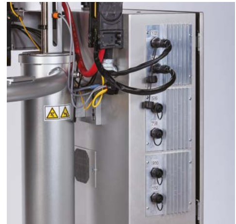
Sechs Anschlusspunkte für die zwölf kundendefinierten Heizzonen

Graco bietet ein umfassendes Angebot an Therm-O-Flow-Heißschmelzsystemen und „point of use“ Schmelzsystemen, die alle entsprechend Ihrer spezifischen Anwendung konfiguriert werden können.