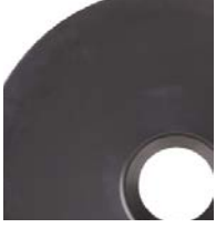
200 l (55 gal)