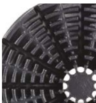
20 l (5 gal)