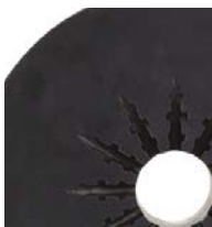
20 l (5 gal)