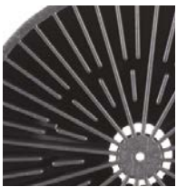
200 l (55 gal)