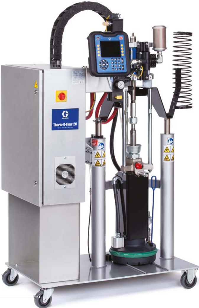
Therm-O-Flow 20 (5 gal)