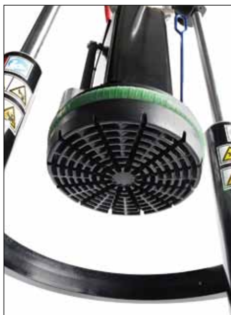
带散热片的加热压盘可提供最高熔胶率，非常适合大流量或难容材料