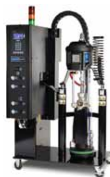
带 NXT 空气马达的 Therm-O-Flow 20