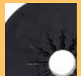
5 gal (20 l)