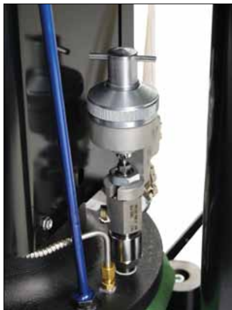
集成桶排气阀方便快速换桶，减少了停机时间