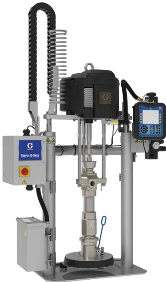
SYSTÈME DE THERMOFUSION THERM-O-FLOW WARM MELT 20 L (5 GAL)