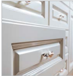
SKABE / INDBYGNING