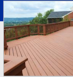
DÆK / RÆKVÆRK