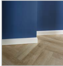
TRIM / STØBNING