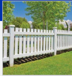
HEGN / MØBLER