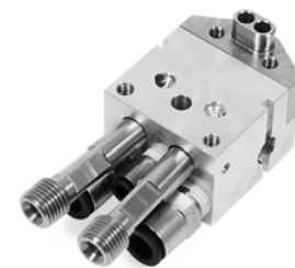
Colector del orificio trasero