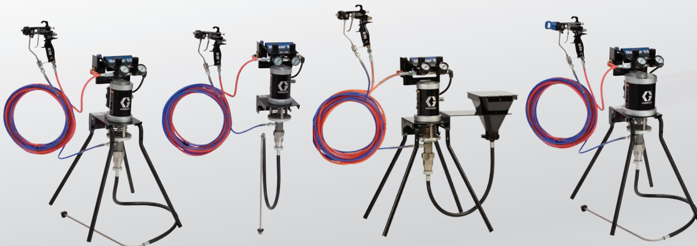
Montagem no suporte 15:1 assistido a ar