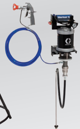
Montagem na parede 30:1 sem ar