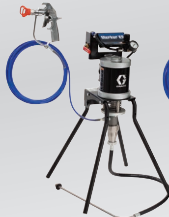
Montagem no suporte 30:1 sem ar