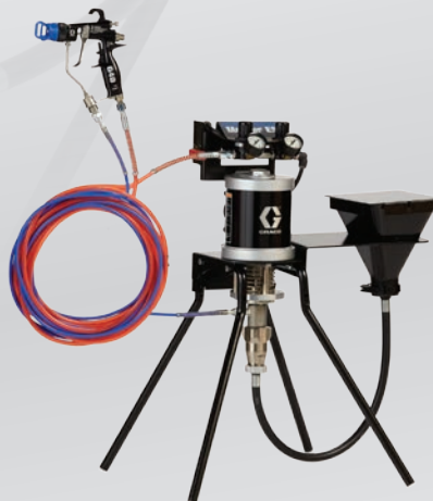
Montagem no suporte 30:1 assistido a ar com funil