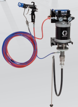
Montagem na parede 30:1 assistido a ar