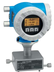
Medidor másico Coriolis