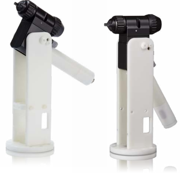
Arka Manifold Tabancası robot montaj parçasıyla