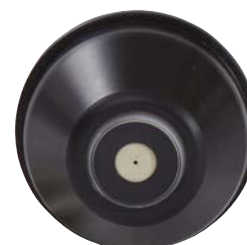
Chapeau d'air pour pulvérisation jet rond