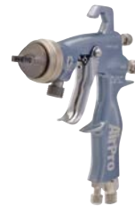
AirPro™ Konforme Pistole