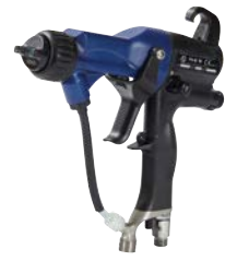
Pro Xp™ Luftspritzen - elektrostatisch