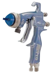
AirPro™ Konventionelle Pistole