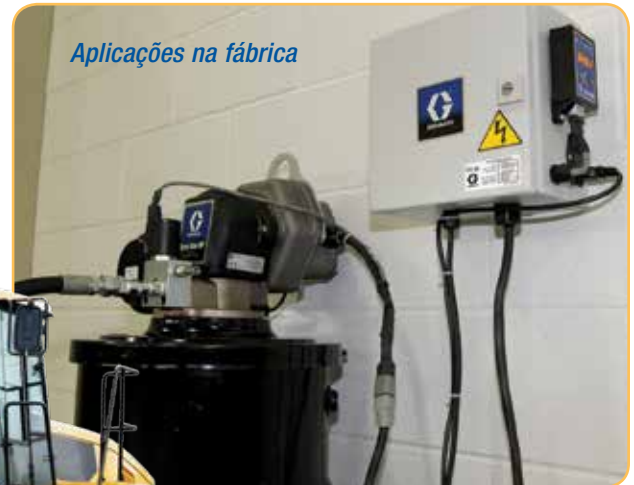
Aplicações na fábrica